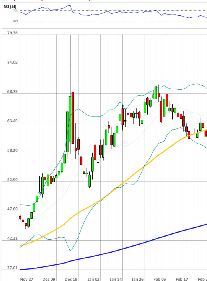
USD/RUB Daily Chart Current price: 61.42

Быки сохраняют значительное численное превосходство над медведями, занимая 75% от всего рынка SWFX, что на 1 п.п. выше значения в пятницу утром.