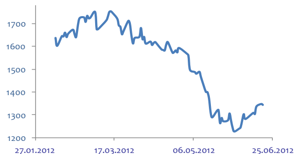
График индекса РТС

Индекс ММВБ вновь попытает тестировать сопротивление на уровне 1390 пунктов, однако техническая картина явно говорит в пользу медведей, поэтому в целом работа «от шорта» предпочтительна.